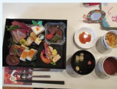
言わばクリスマス懐石？