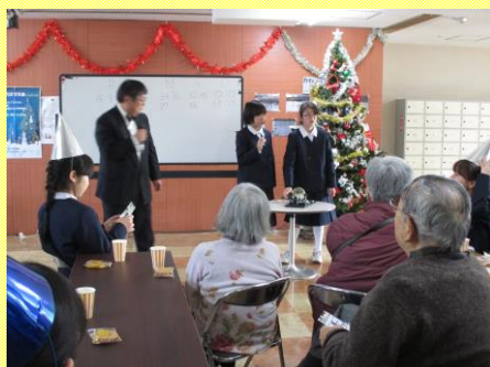
ドキドキのビンゴ大会！