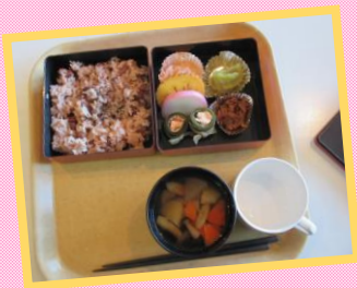
元旦のおせち朝ご飯！