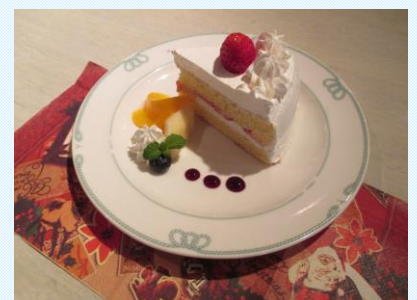
大きなケーキでした♪