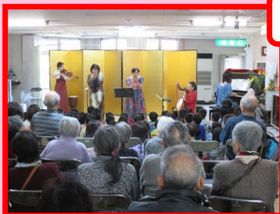
保育園合同新年会♪