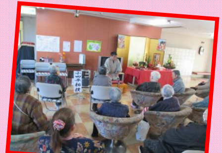
職員による落語披露♪