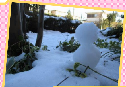
雪も降りましたね～