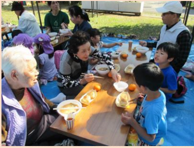
こぼさず食べるんだよ～