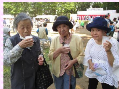
バナナミルク美味しかった♪

本日は、川越市は伊佐沼で行なわれた、『ふれあい福祉まつり』に遊びに行っておきました！今年で第27回という地域の方にとってはお馴染みのお祭りであり、今回も市内各方面の様々な医療・福祉団体やボランティアの方々が賑やかに集まりました。実際、色々なシーンでお世話になっている方のお顔もちらほらと拝見され、楽しく、美味しく、賑やかなひと時となりました♪