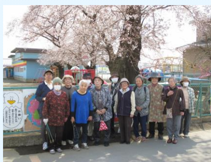
ご近所掃除を兼ねて♪