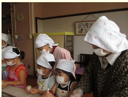
みんなで食べると美味しいね♪

例年『野外食』として保育園の子どもたちと一緒にお庭でお昼ご飯を食べる催しを行なっていますが、今年は貴精保育園が新園舎となったこともあり、折角なのでお披露目がたら新園舎のホールを使っての“合同会食会”となりました♪ 広々としたホールには新築ならではの木の温かな匂いも広がっており、皆さん賑やかにお昼を楽しみました♪