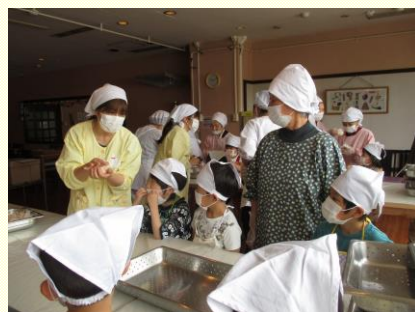
お昼のおにぎりは、一緒に作りました！