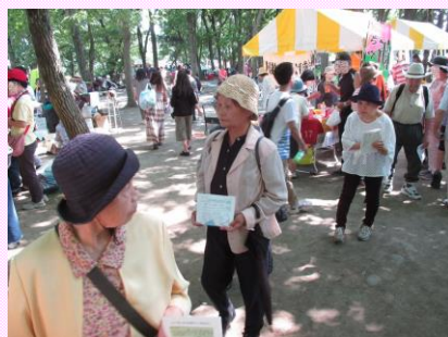
色々なお店があるのね～♪