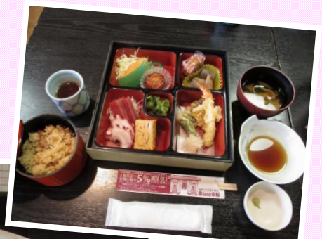
美味しかったです♪